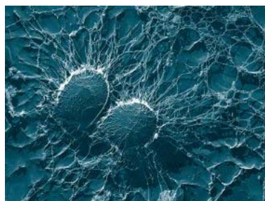
Mikroskopische Aufnahme von MRSA-Bakterien.

Die Regierung spricht davon, dass sich in deutschen Krankenhäusern jedes Jahr mindestens 600.000 Menschen mit multiresistenten Bakterien infizieren, den MRSA. Etwa 40.000 sterben daran. In den Niederlanden gibt es das Problem dieser Krankenhausinfektionen beinahe nicht. Was machen die Holländer anders?